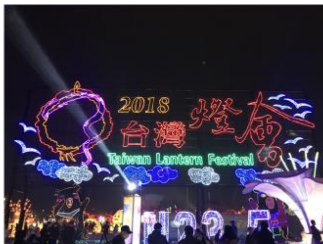
ランタンフェスティバルの様子