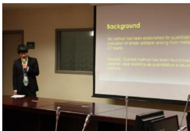
学生の口頭発表の様子②