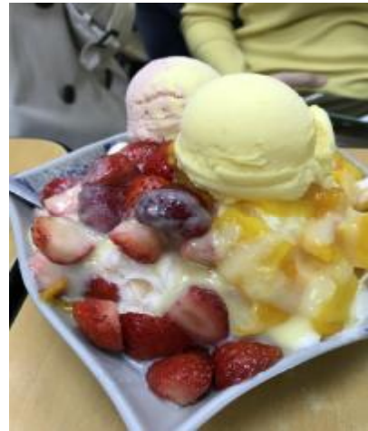
フルーツシャーベット

参加した学生は、多くの人と交流しお互いの今後の目標など話し合い、再会を誓いました。今後さらなる国際化に向けてよい刺激を受けました。