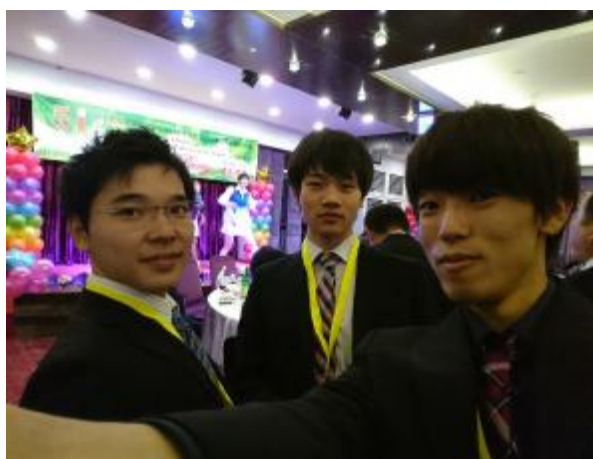
パーティー会場にて①

終日自由行動。学会発表を行う学生は、ホテルで発表の最終確認をしました。学生4名、教員3名が、学会の前夜祭に参加しました。台湾の踊りを見ながら食事を行い、楽しい時間を過ごしました。