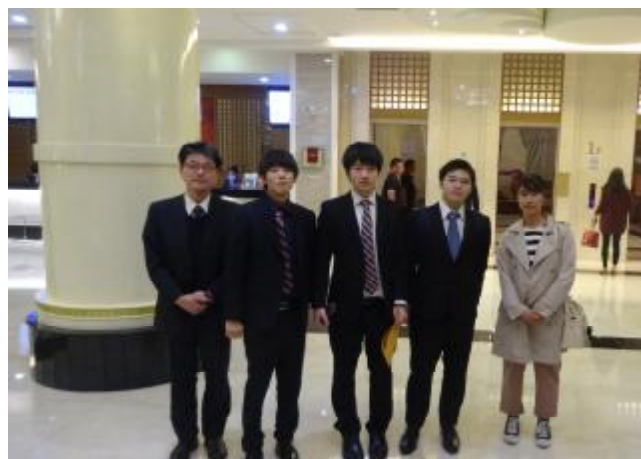
パーティー会場にて②