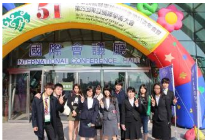
学会会場前で集合写真