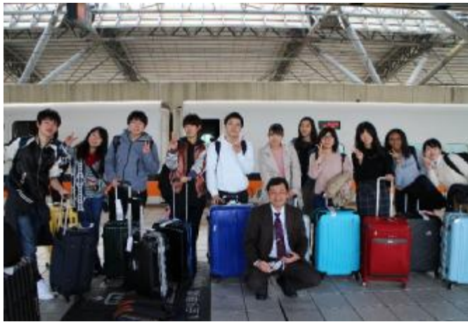
台湾で移動中の様子