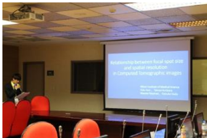
学生の口頭発表の様子①