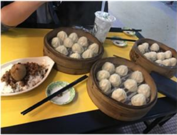
小籠包と魯肉飯（ルーローハン）

飛行機に乗る前に台北の西門町に立ち寄り、小籠包などを食べ台湾文化にも触れました。