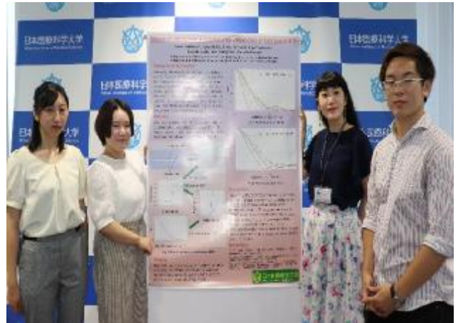
ポスター発表者の写真

今年度は、新型コロナウイルス感染症拡大の影響を受けて、海外渡航を伴う活動が中止となり、物理的交流が制限されています。後期にオンラインによる特別対談や協定校の学生と交流をする予定です。